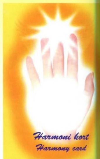
Harmoni kort Harmony card

i mange år. I tillegg til sine gitte evner har de derfor opparbeidet seg bred og solid erfaring. Det er for eksempel ikke alle som kan hjelpes med healing. Jentene har brukt mange kveldstimer på å diskutere hva de skal gjøre med de vanskelige tilfellene de kommer over. – Mennesker med bipolar lidelse er ikke de enkleste tilfellene, men hittil har vi fått hjulpet mange. Det som er ulempen, er at dersom noen går på medisiner, er det ikke så mye som kan gjøres fra vår side. Men det skumleste med det hele er at vi opplever at